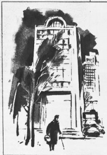
Рисунок Валерия Илларионова.

... Уже и здесь, окруту подминная, Встал ультрасовременный магазин. Она ходила, глаз не поднимая На роскошь осветительных витрин. С морщинистой кожейной повывалась В своем колючем шерстяном платке И думала: не шибко-то осталось От лешивы в потертомом гамачке. Что этот новый мир — он ей неведом, Он чужд и даже страшен иногда, И сыплет лампа одиночным светом, И утекает года в никуда. А на земле, родимой и ненастной, Всё тяжелее нести житье-бытье. И улица взирала безучастно На пауху растерянности её.